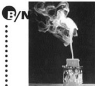
1r Gil Grabulosa