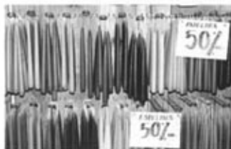
3r Rossend Gri