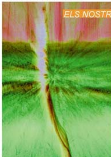
Un dels premis del nostre soci Àngel Vilà.

Aquest estiu molts dels nostres socis han aprofitat per fer fotos i presentar-se a concursos de fotografia. Aquí tenim un petit resum dels socis que han guanyat alguns premis interessants: