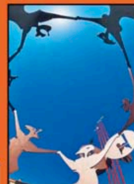
3r Premi Albert Viñas i Farres

Recordeu que farem una exposició de les fotos seleccionades a la Casa de Cultura Les Bernardes de Salt de l'11 fins al 29 de juliol . Tots els participants hi tindran com a mínim una obra.